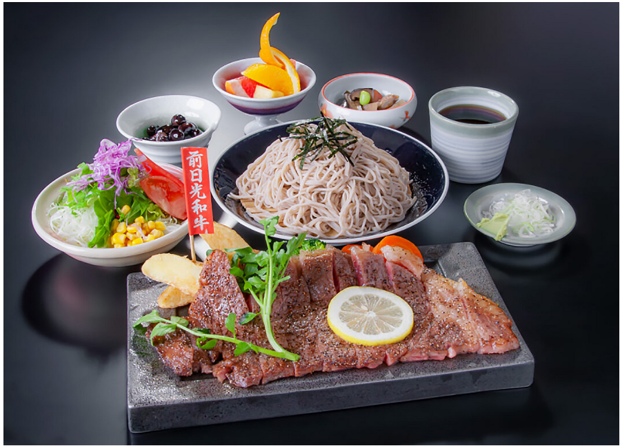
前日光和牛ステーキそば膳